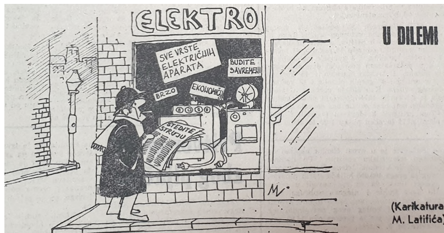
Ilustracija 1: "Oslobođenje", 11. 2. 1976, 5.

planiranje, Glavne direkcije elektroprivrede, Zemaljskog projektantskog zavoda Bosne i Hercegovine i slično, koja tek treba da bude dostupna istraživačima.